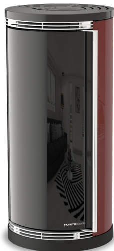
Bordeaux Bordeaux - Bordeaux Bordeaux - Bordeaux